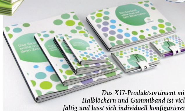
Das X17-Produktsortiment mit Halblöchern und Gummiband ist vielfältig und lässt sich individuell konfigurieren